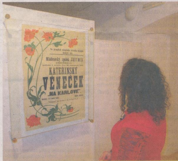
SECESNÍ PLAKÁTY ze začátku 20. století patří mezi nejvydařenější exponáty výstavy v městském muzeu.

„Soutěží se ve čtyřech kategoriích, do 10 let, 11 – 15 let, 16