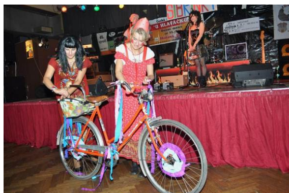
cena pro nejlepší masku