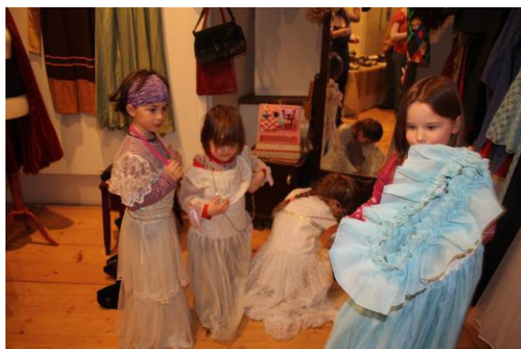
to bylo něco pro děti.....