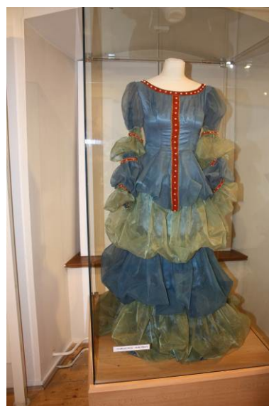
Princezna se zlatou hvězdou na čele - myší kožíšek, šaty princezny Florindely, šaty vévodkyně Glórie