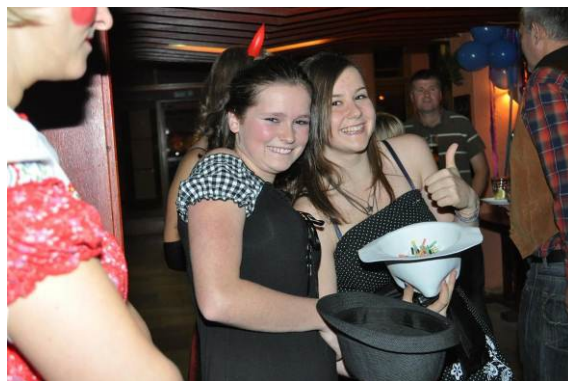
maškarní bez tomboly – nemyslitelné !