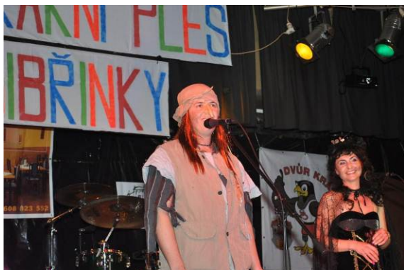
moderátor plesu – BABA JAGA