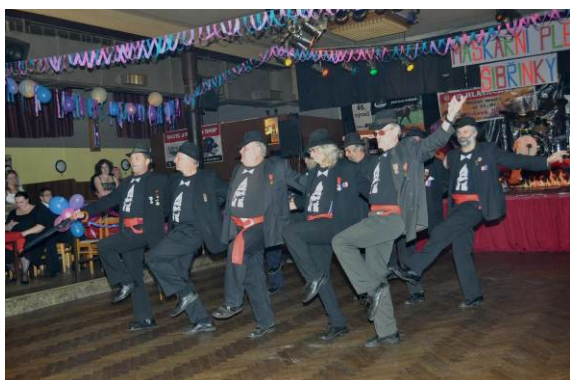
předtančení ARTRÓSA HOŘICE